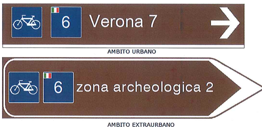
Figura 6 - Segnali di direzione ambito urbano ed extraurbano

chilometri. In ambito extraurbano è proposto un segnale di direzione su fondo marrone di forma conforme a quanto previsto dal Regolamento del Codice della Strada e di composizione analoga a quella della proposta per i segnali di indicazione in ambito urbano.