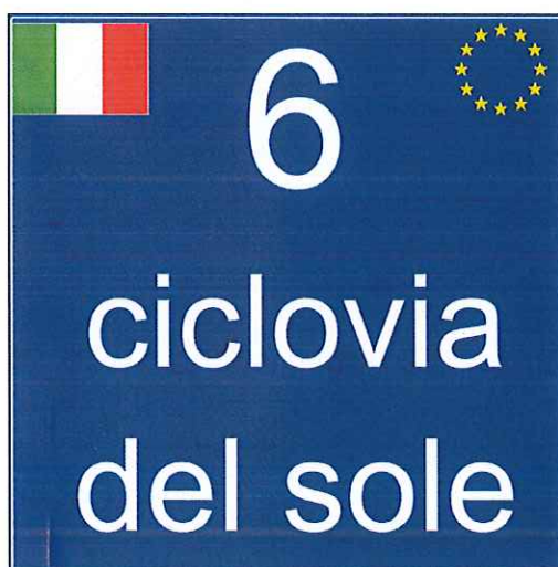
Figura 2 - Segnale di identificazione per ciclovia nazionale appartenente alla rete europea