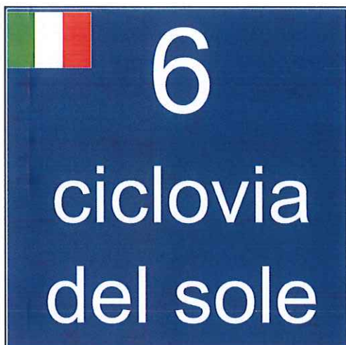
Figura 1 - Segnale di identificazione della ciclovia nazionale