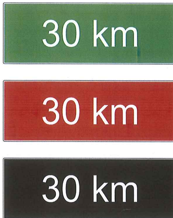
Figura 3 – pannelli integrativi per segnali di identificazione delle ciclovie