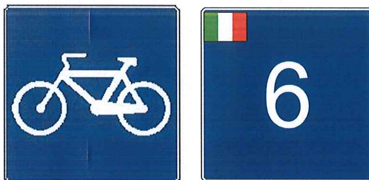
Figura 5 - Simboli di identificazione delle ciclovie